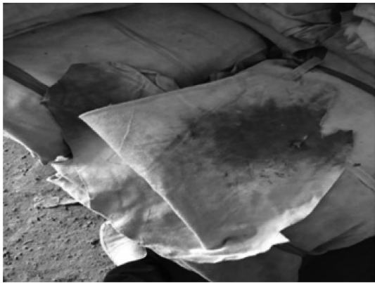
图 1 坯革堆放后部分氧化变色

问题 1: 如图 1 所示的变色问题是什么原因造成的? 刚做出来不久的皮,整理好存放后,皮堆温度很高。